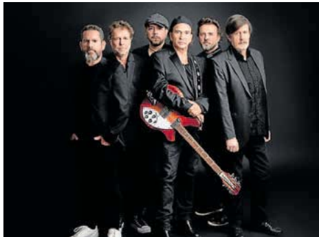
▲ Teatro Arriaga. 'A tu lado'.

20.00 Lizeo Antzokia (8 de enero, 4, Gernika-Lumo) Sesión de cineclub con la proyección de la película 'Disco Boy' (Francia, 2023, 91 min.),