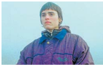
◀ Salón El Carmen. 'Negu hurbilak'.